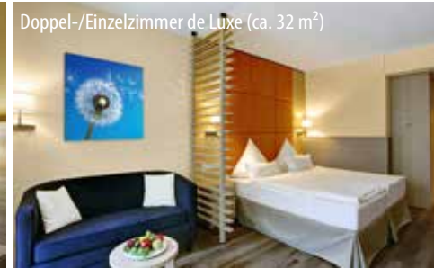
Doppel-/Einzelzimmer de Luxe (ca. 32 m 2 )

Ihr Urlaubsdomizil wird Sie mit ansprechender Ausstattung, umfangreichem SPA & Sport sowie seiner großen Gartenanlage mit Teichen und vielen gemütlichen Liegebereichen begeistern. Das Hotel im Kurviertel besteht aus zwei Gebäudeteilen, die direkt miteinander verbunden sind - dem neu erbauten Refugium und dem total entkernten und sanierten Vitalis. Es ist ausgestattet mit einem komfortabel gestalteten Eingangsbereich mit mehreren Sitzcken, zwei Bars, einer Bibliothek, einer gemütlichen Kamin-Lounge, zwei Buffet-Restaurants, einem À-la-Carte Restaurant, einem Kochstudio sowie einem Café mit Sonnenterrasse und traumhafter Aussicht.