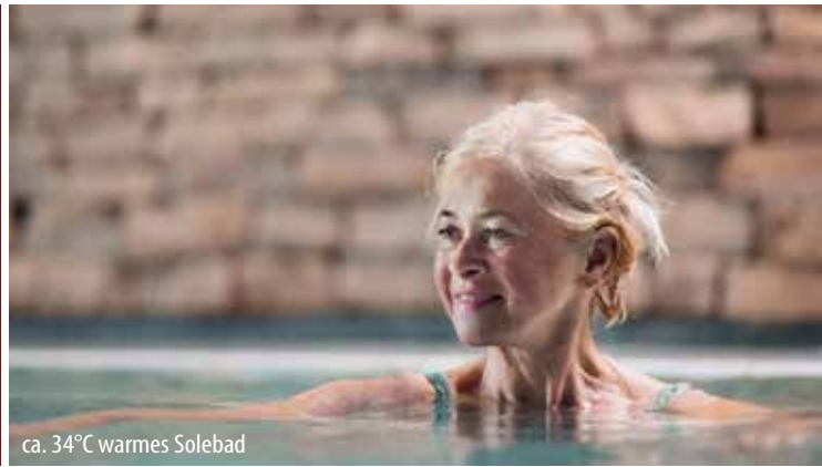
ca. 34°C warmes Solebad