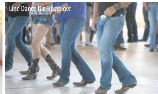
Line Dance für Einsteiger