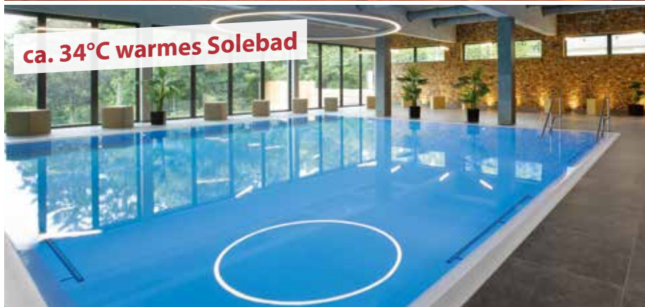
ca. 34°C warmes Solebad

Termine und Preise finden Sie auf dem Anschreiben!