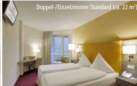
Doppel-/Einzelzimmer Standard (ca. 22 m 2 )