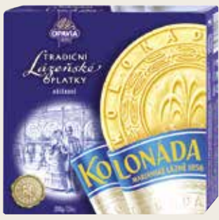
Beliebtes Souvenir: die Marienbader Oblaten

ist das kleinste und beschaulichste Kurbad im westböhmisches Bäderdreieck, nahe der deutschen Grenze und ca. 36 km nordwestlich von Marienbad. Es gehört aber zu den drei meistbesuchten Kurorten in der Tschechischen Republik und seit dem Sommer 2021 zu den „GREAT SPA TOWNS of Europe“, also zum UNESCO-Welterbe. Das Stadtbild prägt ein Ensemble von Gebäuden des 19. Jahrhunderts, die größtenteils in Schönbrunner Gelb und Stuckweiß gehalten sind, sowie weitläufige Parkanlagen. Franzensbad wurde um die Wende vom 18. zum 19. Jahrhundert auf einem 300 m 2 großen, orthogonalen Raster errichtet, dessen Zentrum ein ausgedehntes Thermalquellenfeld bildete. Außergewöhnlich ist das natürliche Gasvorkommen in der Tiefe, das in dieser Konzentration nur an wenigen Orten der Erde vorkommt. Das Naturgas wird bei Erkrankungen des Bewegungsapparates und des Kreislaufes angewendet. Gemeinsam mit der hervorragenden Luftqualität und dem schwefelisenhaltigen Moor finden Kurreisende in Franzensbad ein umfangreiches Spektrum an natürlichen Heilstoffen für Anwendungen vor.